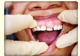
หากไม่ทำการรักษาอาจเกิดอาการปวดร่วมกับอาการบวมมีตุ่มหนอง