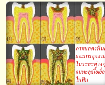
ภาพแสดงฟันผุและการลุกลามในระยะต่างๆ จนทะลุเนื้อเยื่อในฟัน