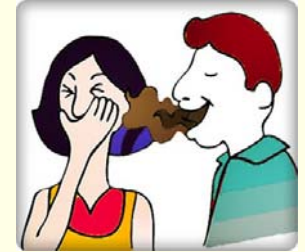
มีกลิ่นปาก