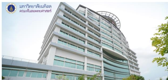
แนะนำหน่วยสิ่งแวดล้อมและอนุรักษ์พลังงาน

คณะทันตแพทยศาสตร์ มหาวิทยาลัยมหิดล ได้ตระหนักถึงความสำคัญในเรื่อง สิ่งแวดล้อม และอนุรักษ์พลังงาน ทั้งของบุคลากรผู้มาปฏิบัติงาน และผู้มารับบริการทุกคน รวมไปถึงสภาพแวดล้อมของมหาวิทยาลัย และชุมชนโดยรอบ จึงวางแนวทางที่จะพัฒนาภาพและสิ่งแวดล้อม และได้จัดตั้งหน่วยสิ่งแวดล้อมและอนุรักษ์พลังงานขึ้น