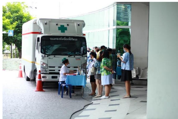
รูป การตรวจสุขภาพประจำปี 2563 ของบุคลากร