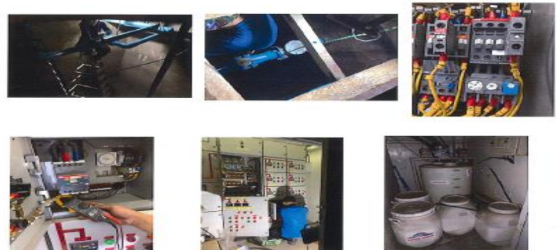
งานแก้ไขผู้ควบคุม ตรวจสอบอุปกรณ์ที่ชำรุด และ Test run ระบบ

สำหรับ : ผู้ควบคุมงาน (ลงชื่อ)..... ผู้ควบคุมงาน สำหรับ : ผู้รับจ้าง (ลงชื่อ)..... ผู้รายงาน