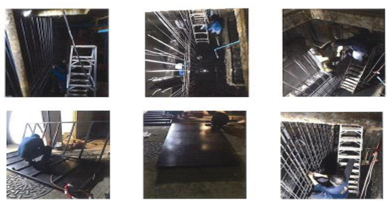
ผูกโครงเหล็กเข้ากับ ผนังบ่อ และขึ้นแม่แบบก่อนทำการเทปูนกันบ่อ

สำหรับ : ผู้ควบคุมงาน (ลงชื่อ)..... ผู้ควบคุมงาน สำหรับ : ผู้รับจ้าง (ลงชื่อ)..... ผู้รายงาน